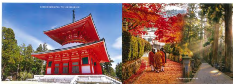
船内特別ラッピングイメージ

具体的には、「①船内特別ラッピングの実施」「②船内2大イベントの実施」「③SNS を用いた割引券プレゼント企画の実施」の3施策を予定しています。ぜひ本機会に南海フェリーを利用いただき、高野山や四国霊場の魅力に触れていただければと思います。詳細は以下のとおりです。