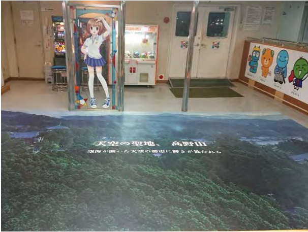
参考：船内のラッピングの様子