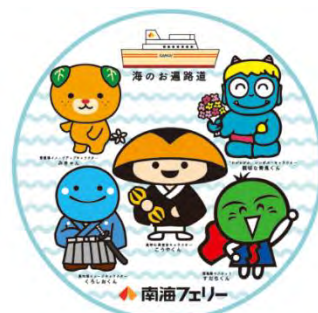
高野山・四国4県のゆるキャラも登場!?