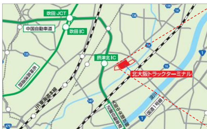
北大阪トラックターミナル位置図