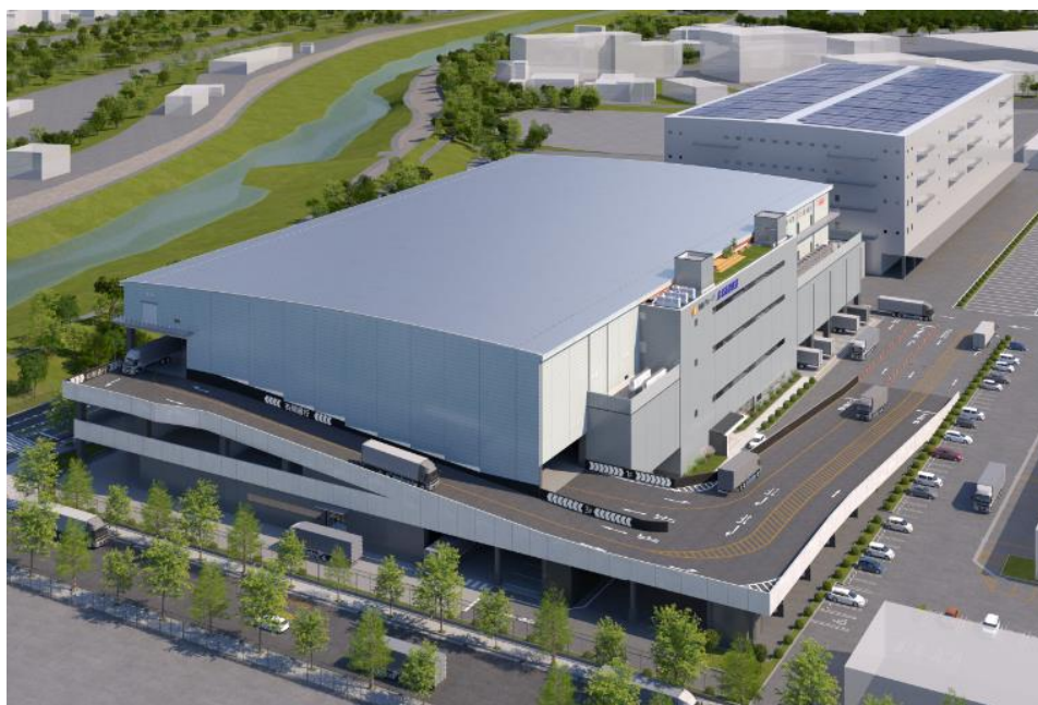
北大阪トラックターミナル1号棟 外観パース