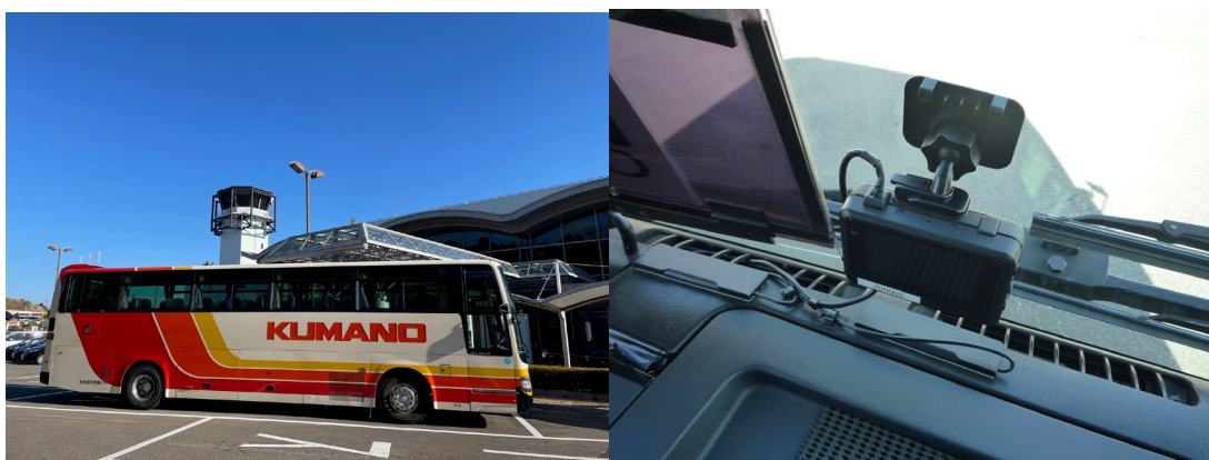
空港リムジンバス（全景）

https://www.mlit.go.jp/sogoseisaku/maintenance/03activity/pdf/05_19.pdf