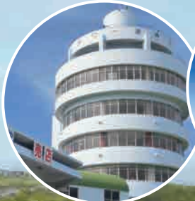
潮岬観光タワー Shionomisaki Tower