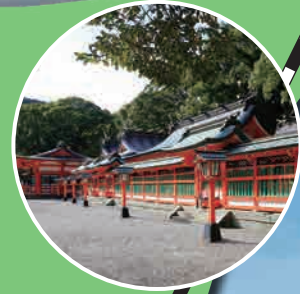
熊野速玉大社 Kumano Hayatama Taisha Grand Shrine