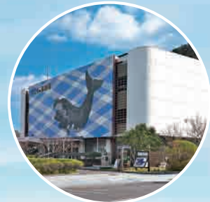
くじらの博物館 Taiji Whale Museum