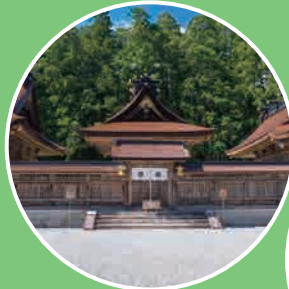
熊野本宮大社 Kumano Hongu Taisha Grand Shrine