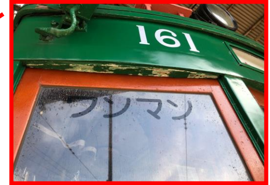
④外板の腐食・塗装劣化