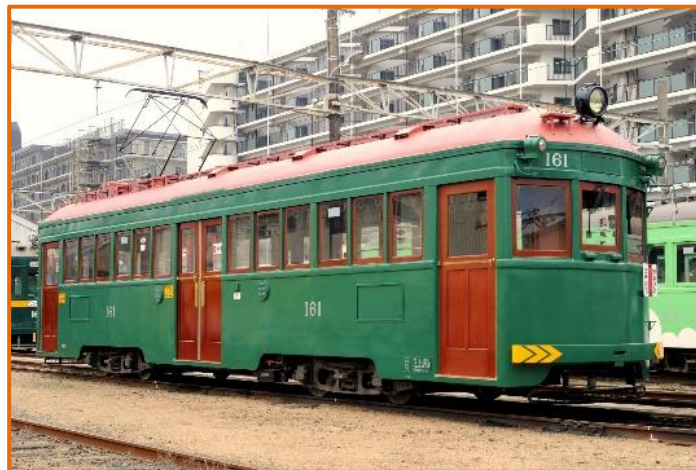
※修繕後のイメージ (画像は、前回の復原時)