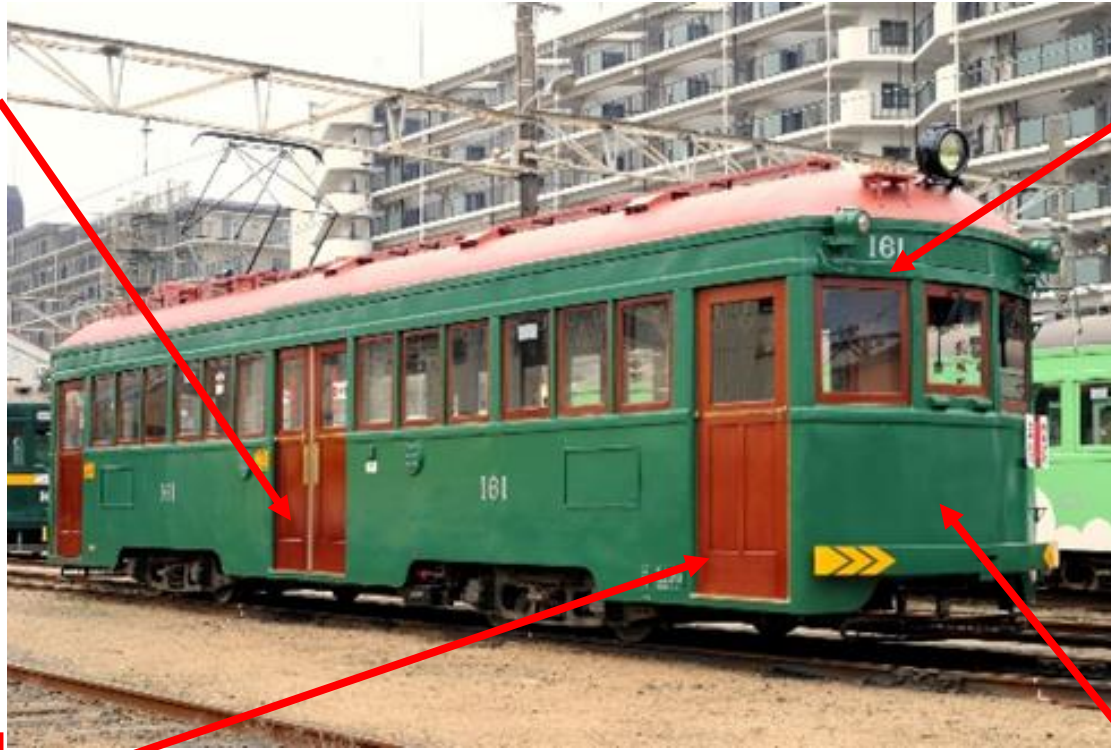
③窓枠周りの木部腐食