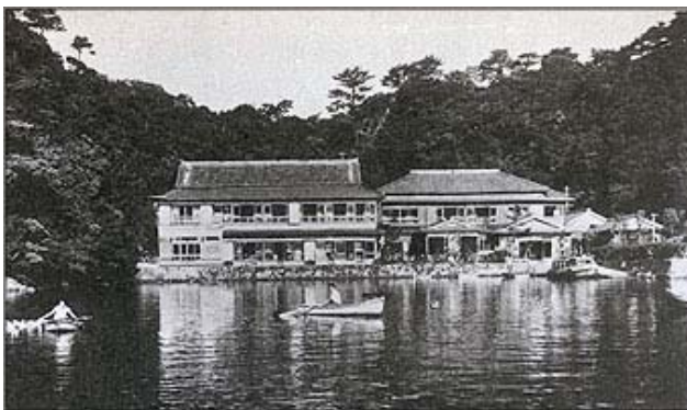
昭和 25 年頃の中の島旅館

南海電鉄及び当社は、昭和 33 年に当時の島の所有者より全島を買い受け、中の島旅館の営業を継承し、その後ホテル中の島と改名し、昭和 34 年の紀勢線全線開通や昭和 44 年の国道 42 号線の拡幅・舗装完成による那智勝浦へのお客様の増加にあわせるように建物の規模を拡大していきました。