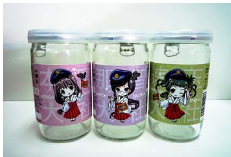
「くまのみこかっぷ」尾崎酒造

弊社が運航しております瀧峡ウォータージェット船のPRポスターにキャラクターを活用することで、新しい顧客層へのPRを行ってまいります。