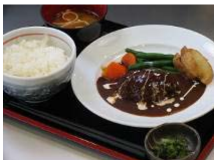
熊野牛の手作りハンバーグ