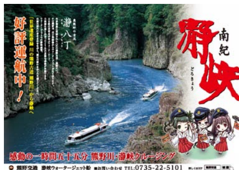
瀧峡ポスター（イメージ）