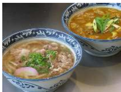
熊野牛肉うどん、カレーうどん