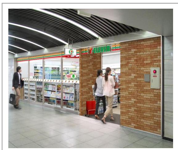
<< 外観イメージ >>