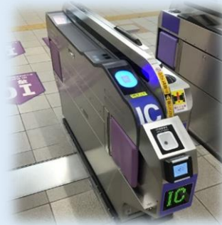
一体型改札機 (泉北高速鉄道)