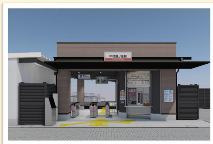
▲新しい駅舎(イメージ)