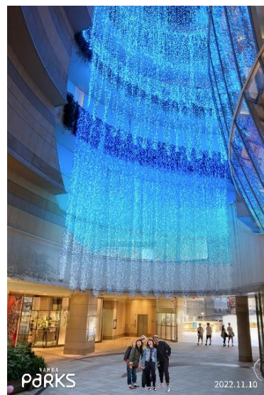
「マチカメ」撮影(イメージ) 【2階グレイシアコート 光の滝】