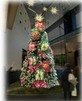
【パークスタワー1階】