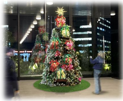
【なんばスカイオ10階】

その一環として「働く今日も‘なんかいいいね’」をコンセプトに、オフィスでもイルミネーションを楽しんでいただくべく、なんばスカイオ10階とパークスタワー1階のオフィスロビーにクリスマスツリーを設置します。ツリーの装飾には「ロスフラワー」を使用し、後日オフィステナントの従業員様にプレゼントを予定。自然の大切さ・美しさを発信するとともに、なんばで働くことへの満足度向上を図ります。