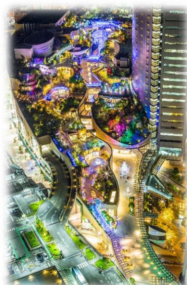
画像はすべてイメージです。

今年、投影されている部分の上を歩くと反応する体験型イルミネーション「光のハーモニー」などを新たにご用意しているほか、「光の滝」の前でスマートグラスを装着いただき、イルミネーションが煌めく世界を海の生き物たちが自由に泳ぎまわる姿が見られる近未来的なAR水中ツアーイベント「イルミネーションダイビング」を体験いただけるなど、「なんば光旅」を通じて、ワクワクや感動をお届けします。詳細は以下のとおりです。