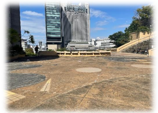
パークスガーデン8階

ゲストについては、確定次第、「なんばソトフェス」公式サイトや公式 Instagram などで発表します。