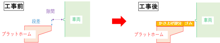
ホームと車両の段差・隙間縮小工事イメージ図