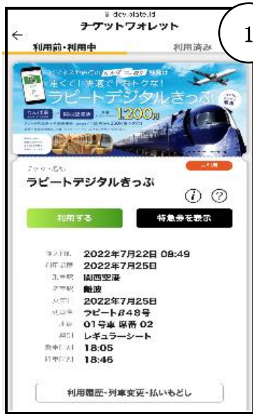
①購入済みの乗車券を選択

○乗車方法 南海アプリ内 南海デジタルきっぷ→チケットウォレットから利用可能です。