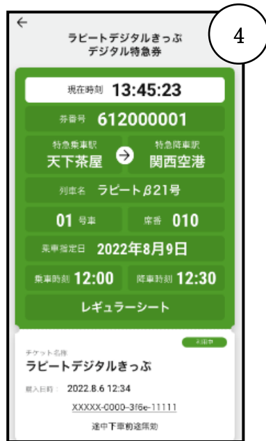
④「特急券を表示」より座席を確認