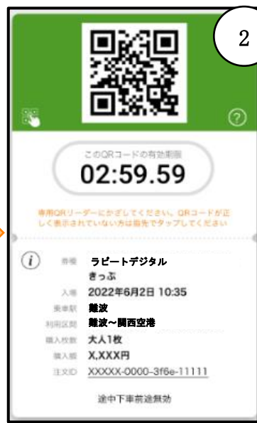
②QR 乗車券を呼び出し