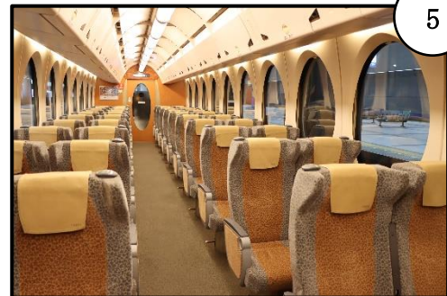
⑤目的地まで快適な時間をお過ごしください