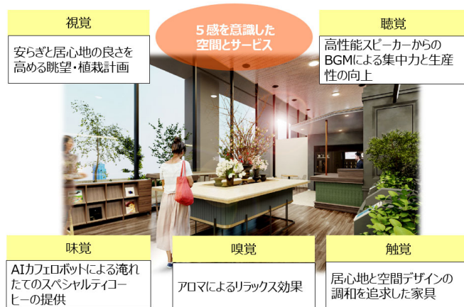
施設の特徴イメージ