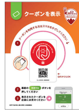
クーポン利用 (スマートプレート)イメージ