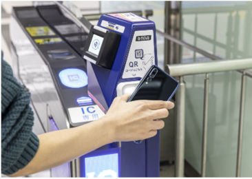
鉄道利用イメージ