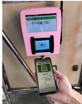
バス利用イメージ