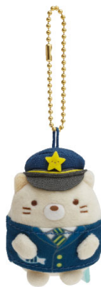
©2021 San-X Co., Ltd. All Rights Reserved.