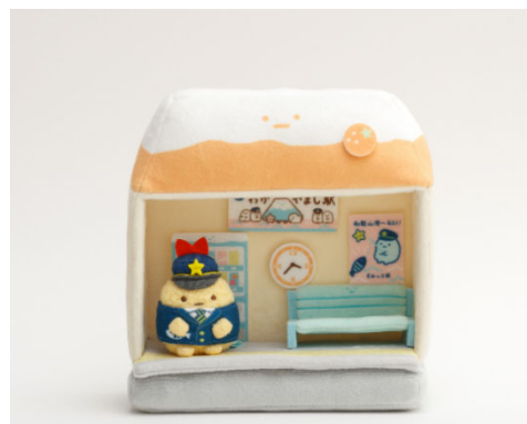
©2021 San-X Co., Ltd. All Rights Reserved.

ウ、シーンぬいぐるみ(和歌山市駅) えびふらのしっぽ てのりぬいぐるみ付き (3, 850円)