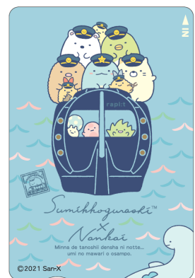
©2021 San-X Co., Ltd. All Rights Reserved.