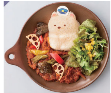
©2021 San-X Co., Ltd. All Rights Reserved.