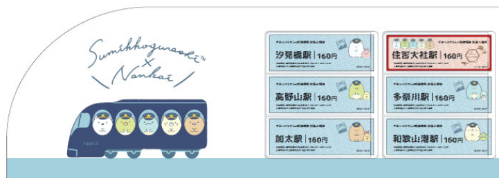
▲すみっこぐらしの駅入場券(イメージ)