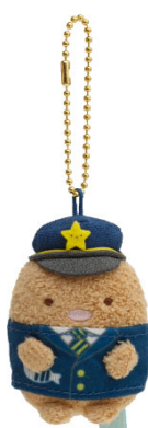
©2021 San-X Co., Ltd. All Rights Reserved.