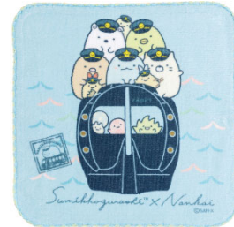
©2021 San-X Co., Ltd. All Rights Reserved.