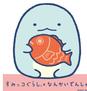
すみっこぐらし×なんかいでんしゃ