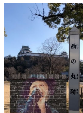
AR機能を使用した撮影写真のイメージ(和歌山城)