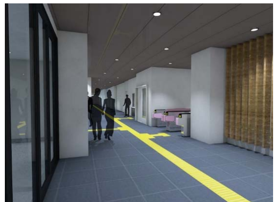
1階南北通路(リニューアルイメージ)