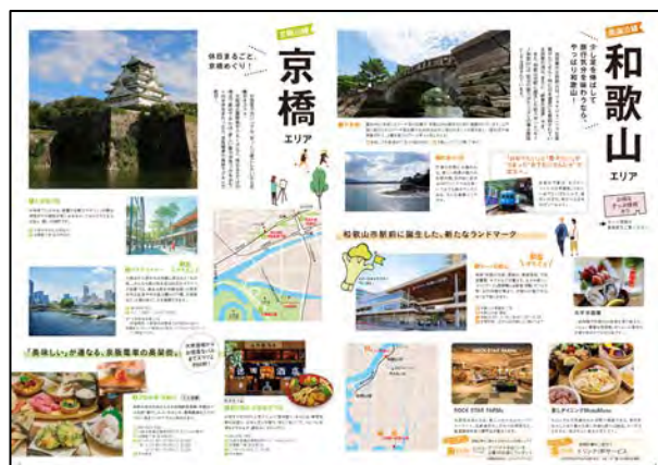
パンフレット「京阪・南海沿線 日帰リエえとこめぐり」