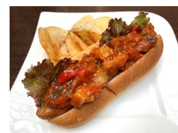
「ラタトゥイユドッグ」