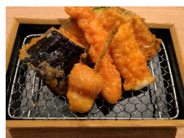
「天ぷら盛り合わせ」