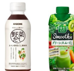
使用するカゴメの商品の一例

「ごま豆腐のラタトゥイユ・大豆あんかけ」（左） 「高野うどんに欧風煮込み野菜と天婦羅を添えて」（右）