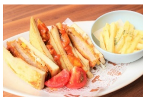
「2種の高野豆腐サンドイッチ ポテト添え」