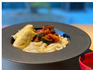
特別コラボメニューの一例

「ごま豆腐のラタトゥイユ・大豆あんかけ」（左） 「高野うどんに欧風煮込み野菜と天婦羅を添えて」（右）