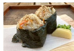
「鶏ごぼうの野菜だしむすび」