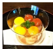
「西南院カラフル白玉」