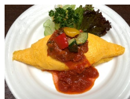
「ラタトゥイユオムライス」