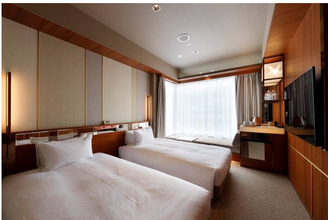
コーナーツインルーム