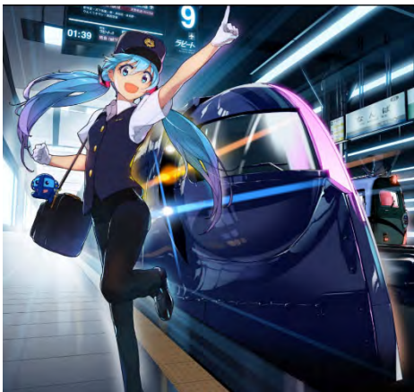
ill. by apapico © CFM piapro