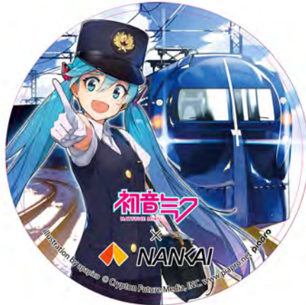
ヘッドマークイメージ