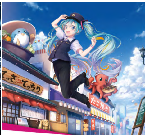
ill. by まおう © CFM piapro