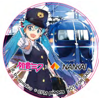
限定ピンバッジイメージ