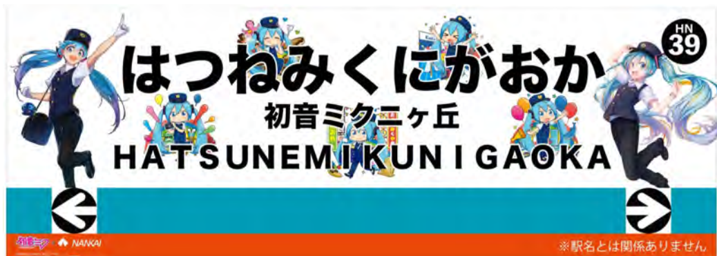
駅名ポスターイメージ