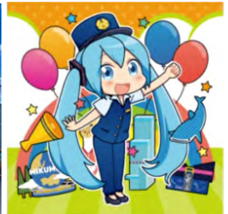
ill. by のくはし © CFM piapro