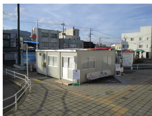
橋本駅前広場にお客さま待合所などを整備