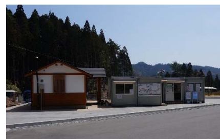
代行バスと路線バスの乗換場所(バス停)としてお客さま待合所などを整備