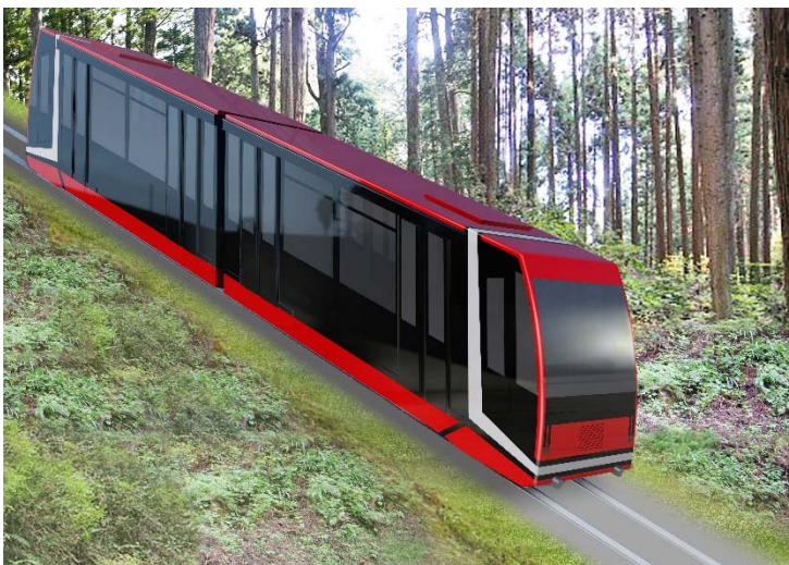
「新型 高野山ケーブルカー」1号車 イメージ

なお、新造工事期間中はケーブルカーを運休し、バスによる代行輸送を実施いたします。皆さまにはご不便、ご迷惑をおかけいたしますが、何卒ご理解を賜りますようお願い申し上げます。