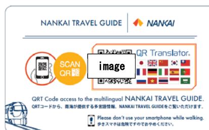
QRコードを掲載したカード