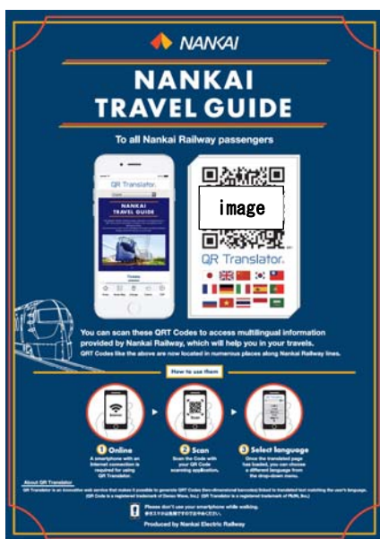
QRコードを掲載したポスター

【設置駅】 難波駅、新今宮駅、天下茶屋駅、りんくうタウン駅、関西空港駅、橋本駅 ※上記は主な設置駅であり、その他の駅に設置する場合があります。