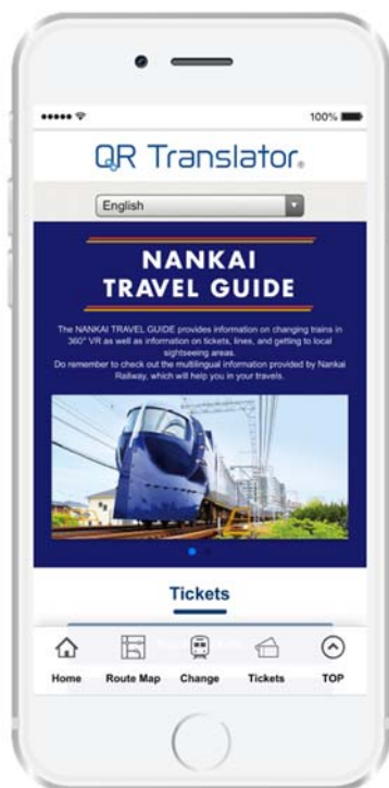
「NANKAI TRAVEL GUIDE」 スマートフォン使用画面イメージ（英語）