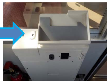
列車の運転台に設置する放送装置