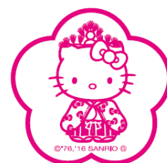
スタンプデザイン例