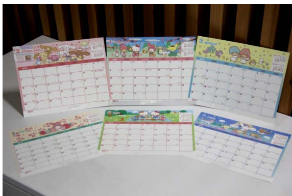
サンリオキャラクターズ 卓上カレンダー