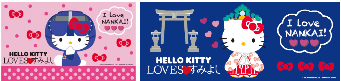
ハローキティ ステッカー(デザイン)

住吉大社駅の各所に制服やラピートの着ぐるみを着た南海電鉄ならではの「ハローキティ」や、巫女や一寸法師など住吉大社を想起させる姿をした「ハローキティ」のデザインを施します。