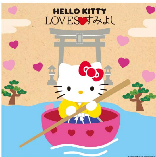
「種貸社」に設置のパネル（デザイン）

住吉大社境内の末社のうち、一寸法師ゆかりで資金調達・子宝の神さまである「種貸社（たねかししゃ）」、縁結び・夫婦円満などの神さまである「侍者社（おもとしゃ）」、初辰まいり中心の御社で商売繁盛・家内安全の神さまである「楠琺社（なんくんしゃ）」の3カ所に記念撮影用の「ハローキティ」パネルを設置します。また、撮影用の小道具も設置していますので、小道具を使用したの撮影も可能です。