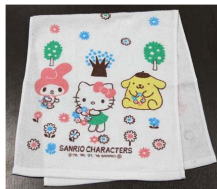
サンリオキャラクターズ タオル