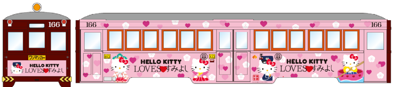
車両外観デザイン（正面）