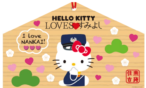
巨大絵馬（デザイン）