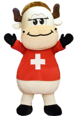
スイスホテル南海大阪PR部長 「みなみモウ」