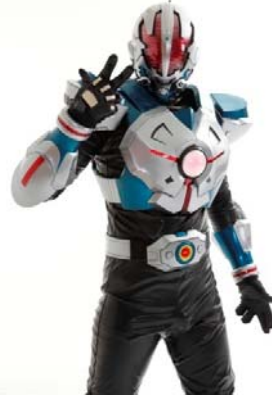
日本橋のご当地ヒーロー 「地球戦士ゼロス」