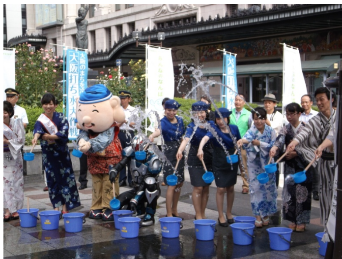
昨年の打ち水セレモニーの様子