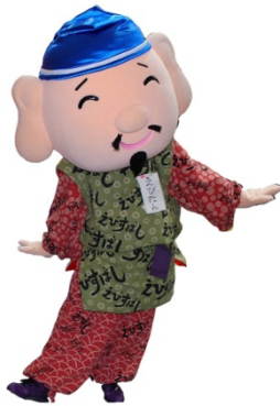
戎橋筋商店街振興組合 「えびたん」

※セレモニー終了後、一部企業および団体が各実施場所(次ページ参照)で打ち水を開始します。