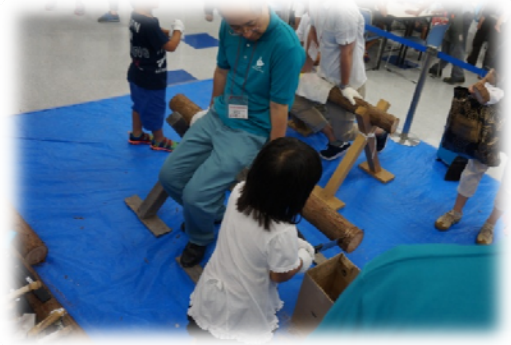
昨年のエコワークショップの様子