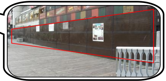
【展示場所】側壁パネル