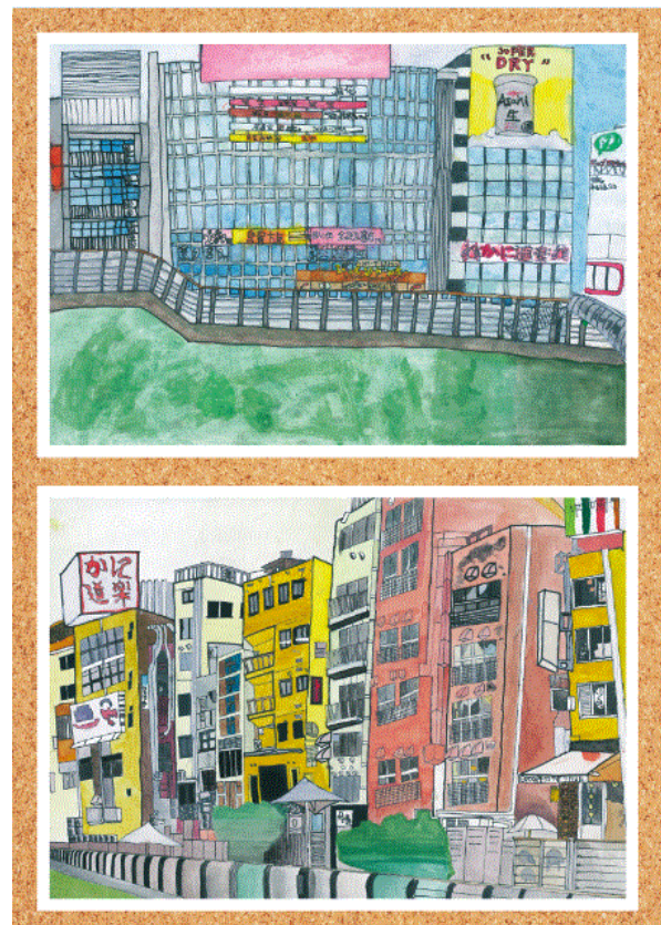
展示する作品(一例)