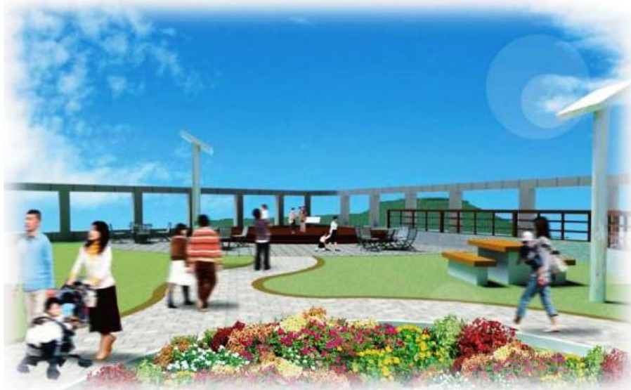
眺望デッキを備えた屋上広場