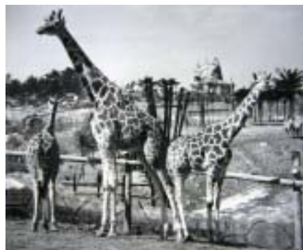
昭和33年のみさき公園

このため「キリンが1頭もないのはあまりにも寂しい」と、同年に2頭を購入し、現在ではそのうちの1頭であるオスの「センイチ」を飼育しています。