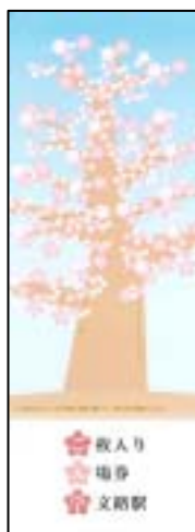
台紙の五分咲きのサクラが

当社では同入場券に「合格を勝ち取って、満開のサクラの季節を笑顔で迎えていただきたい」と願いを込めました。受験生の皆さまに「絶対に合格するぞ！」と勉強への意欲をかきたてていただければ幸いです。