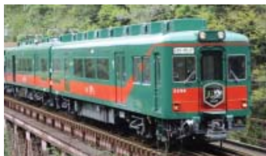
運行開始1周年を迎える「天空」