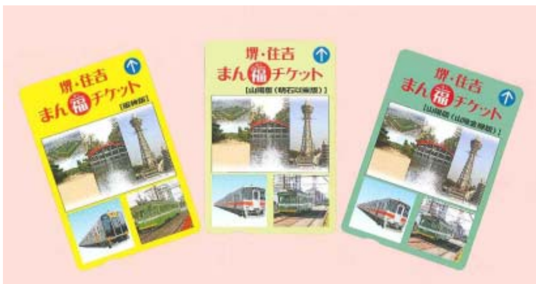
堺・住吉まん福チケツト阪神版・山陽版

パンフレットに掲載している堺、住吉、新世界エリアの特典施設・店舗で、同チケツトを呈示すると、割引やプレゼントなどの特典を受けることができます。