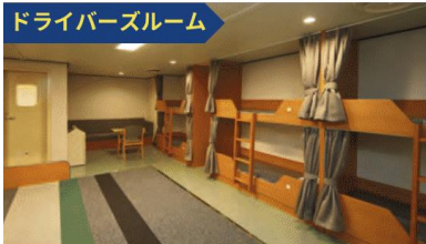
ドライバーズルーム

※前年同月実績を上回る台数分の運賃を50%割引いたします 対象車両：長さ5m以上の貨物車両で同乗者は対象外となります