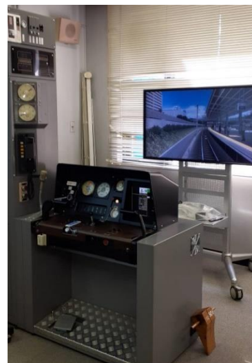
運転シミュレータ