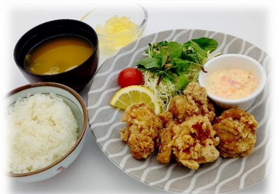
○ からあげランチ 980 円 (税込)