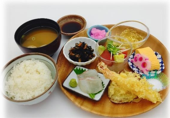
○ 岬ランチ 1,200 円 (税込)