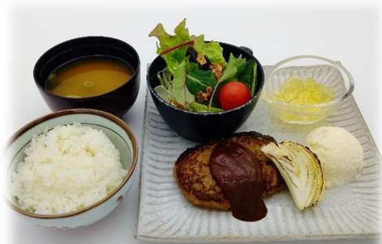
○ ハンバーグランチ 1,100 円 (税込)