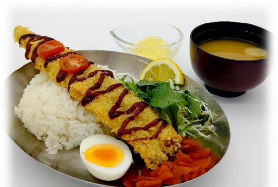
○ あなごロケット丼 950 円 (税込)