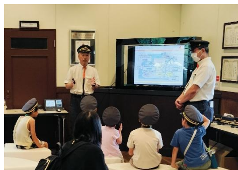
昨年のおしごと体験の様子