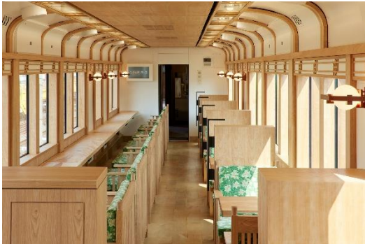
2号車ワイドビューシート

3月20日(金)に定期運行を終了した観光列車「天空」(橋本駅ー極楽橋駅)に代わり、4月24日(金)に運行を開始します。2000系車両の4両編成で、合計70席を備え、難波駅ー極楽橋駅間を結びます。リクライニング座席を設置した1号車「リラックスシート」や、車窓をお楽しみいただけるよう工夫した2号車「ワイドビューシート」、ゆったりとお食事をお楽しみいただける4号車「グランシート/グランシートプラス」、さらに3号車は、ご乗車のすべてのお客さまにご利用いただける「ロビーラウンジ」を設けました。内装には沿線にゆかりのある工芸品等を取り入れ、4号車のお食事では泉州・南河内・和歌山の旬の食材を使用するなど、沿線地域の魅力に触れ、新しい発見を味わえる列車旅を提供します。