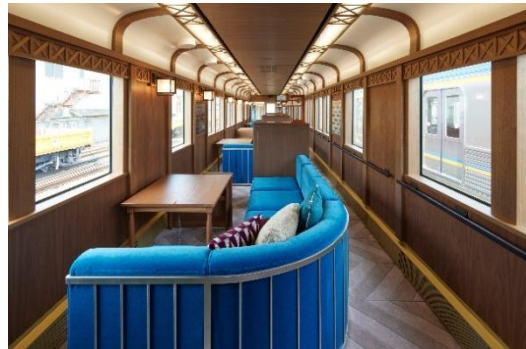
4号車グランシート/グランシートプラス