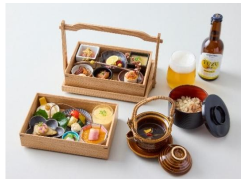
4号車で提供するランチメニュー (2026年春夏)