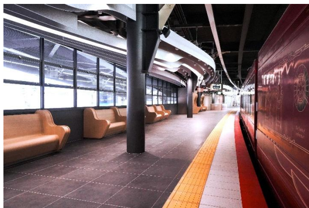
専用ホーム 難波駅「0番のりば」