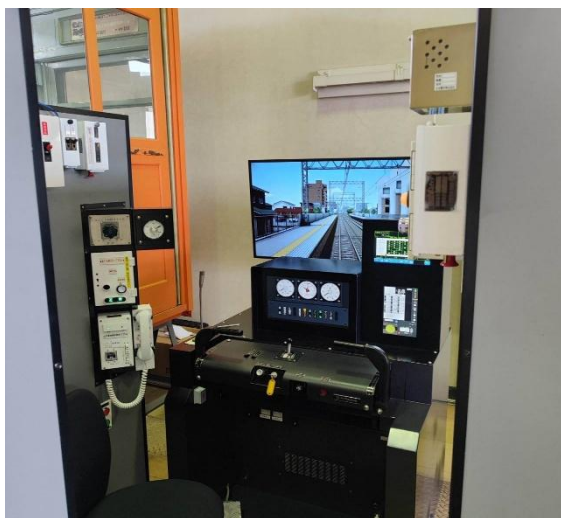
運転シミュレータ

本体験ツアーは、普段は関係者以外立ち入ることのできない南海電鉄の鉄道研修センターで、運転士養成のためのシミュレータを使用した運転体験を提供します。参加者は、実際の運転士養成講師による座学講習を受けた後、シミュレータで運転体験を行い、さらに研修センターの見学では保安装置や駅務機器など普段見ることのできない鉄道の裏側を体験することができます。