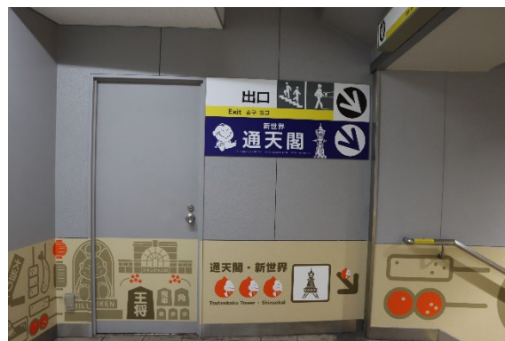
駅構内の案内イラスト