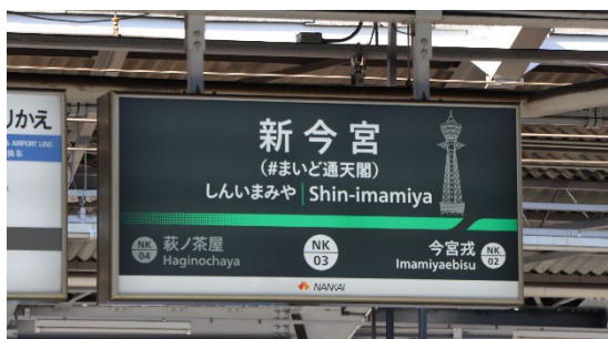
高野線 難波行きホームの駅名標

なお、各駅の駅名標は新たなデザインへ更新予定であり、新今宮駅はその第1弾となります。