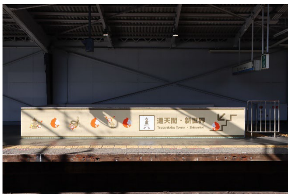
ホームの案内イラスト

副駅名の導入に合わせ、ホームから、通天閣へ続く出入口通路には「ビリケンだるま」による案内イラストを掲出し、通天閣を目的地とするお客さまが迷わず向かえるよう視覚的に案内します。その他、待合室やエレベーターも装飾し、通天閣へ向かうワクワク感を醸成します。