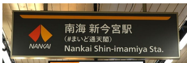
4階改札口の駅名標