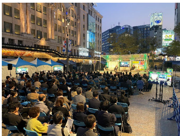
第1回 NAMBA MASHUP 開催の様子