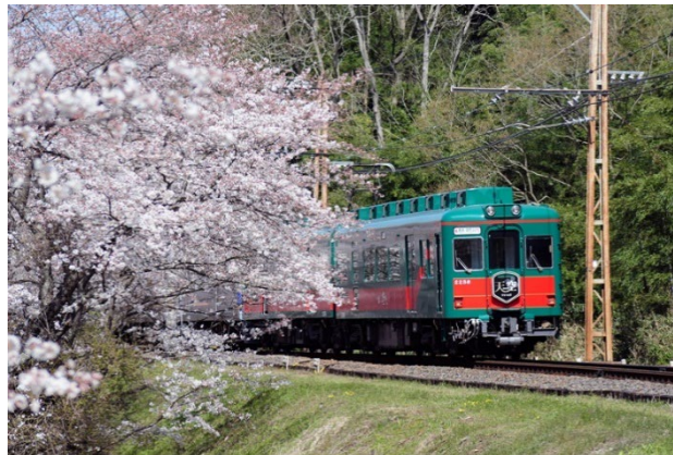
桜並木と「こうや花鉄道 天空」