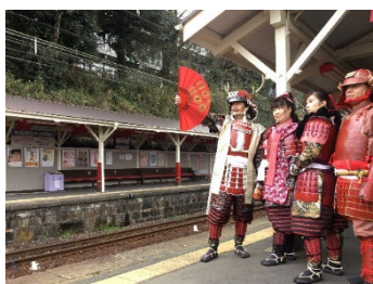
紀州九度山手作甲冑真田隊が車内に登場！