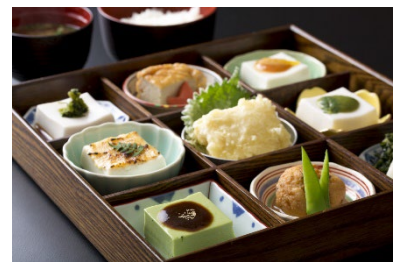
角濱ごまとうふ総本舗でのお食事