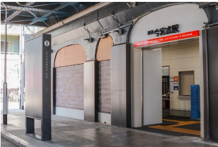
リニューアルした今宮戎駅入口