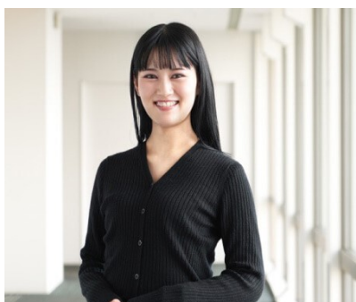
2022年4月入社社員 (所属:鉄道事業本部 施設部)