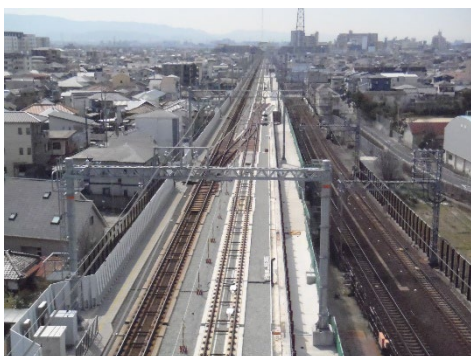
高師浜線高架化工事前(羽衣駅南側)