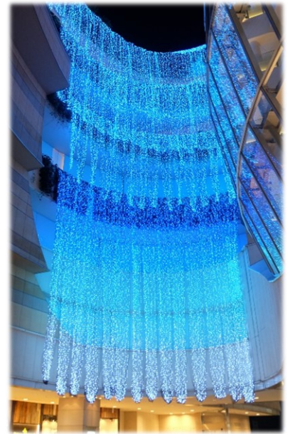
なんばパークス2階「光の滝」

さらに、昨年好評であったイルミネーションが煌めく世界を、海の生き物たちが自由に泳ぎまわる姿が見られる、近未来的なAR水中ツアーイベント「イルミネーションダイビング」を今年も開催します。詳細は次ページに記載します。