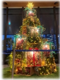
【なんばスカイオ10階】

その一環として「働く今日も‘なんかいいね’」をコンセプトに、オフィスでもイルミネーションを楽しんでいただくべく、なんばスカイオ10階とパークスタワー1階のオフィスロビーにクリスマスツリーを設置します。ツリーの装飾には「ロスフラワー」を使用し、後日オフィステナントの従業員様約200名に抽選でプレゼントを予定。自然の大切さ・美しさを発信するとともに、なんばで働くことへの満足度向上を図ります。