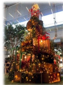
【パークスタワー1階】