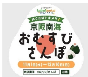
おむすび窓ステッカーイメージ