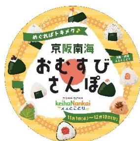
おむすびヘッドマークイメージ