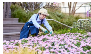
▲専属ガーデナー イメージ