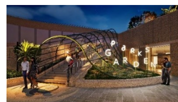
▲リニューアル竣工時の姿(夜)