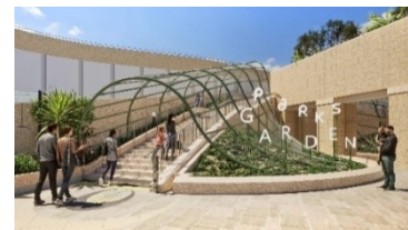
▲リニューアル竣工時の姿(昼)