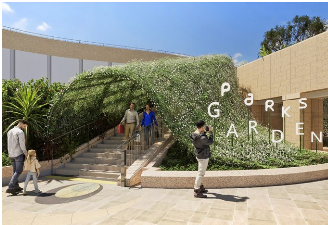
▲ジャスミンが生育した姿

ガーデンへの好奇心を喚起する緑のゲート。巨大な緑の丘が、グランドレベルからのガーデンへの入口としてお客さまを誘います。植物の瑞々しい香り いざな を全身で浴びることができます。長い年月をかけて成長していく植物の生命を表現するような、ジャスミンの生育とともに日々移ろい変わるゲートの姿をお楽しみください。