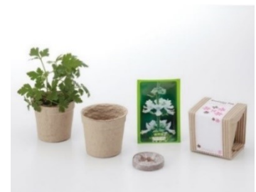
▲エコポットハーブ栽培セット