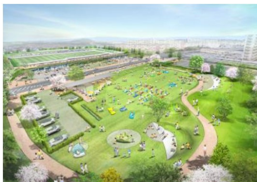
サッカースタジアム併設の 南花台中央公園(2025年に完成予定・イメージ図) ※当日は建設予定地を見学予定です。

10:00 集合 河内長野駅 10:10 見学 あいっく[子育て支援拠点] 10:40 体験 木根館(※お子さま限定 制作体験) 11:00 見学 南花台エリア 12:20 説明 市の魅力について 12:40 見学 くろまろの郷[道の駅] 13:30 解散 三日月町駅