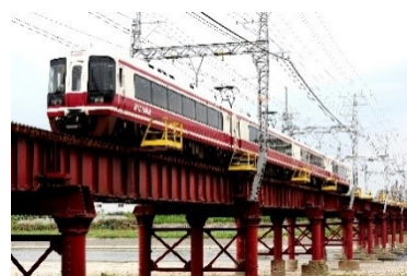
【南海・特急チケットレスサービスポイント】 特急「こうや」「りんかん」等の座席指定券などに利用可能 通勤通学でご利用いただけます