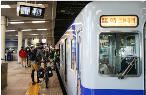
（昨年度の実証実験）難波駅出発シーン

今回のツアーにより、公共交通である鉄道と自転車を組み合わせる「サイクルトレイン」が、和歌山県のサイクルツーリズムの一つの手段として、よりご利用いただきやすくなるよう検証してまいります。詳細は別紙のとおりです。