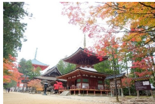
高野山・壇上伽藍