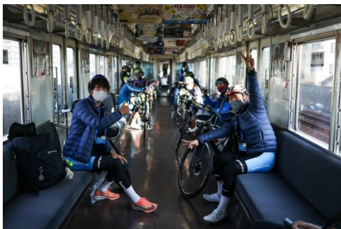
（昨年度の実証実験）サイクルトレイン車内