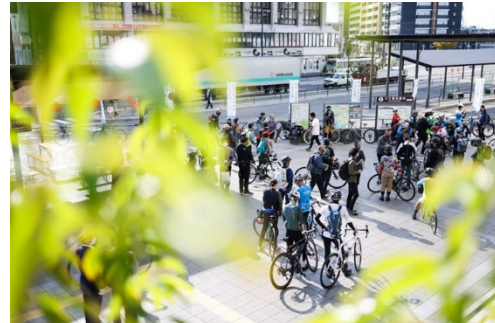
（昨年度の実証実験）和歌山市駅到着