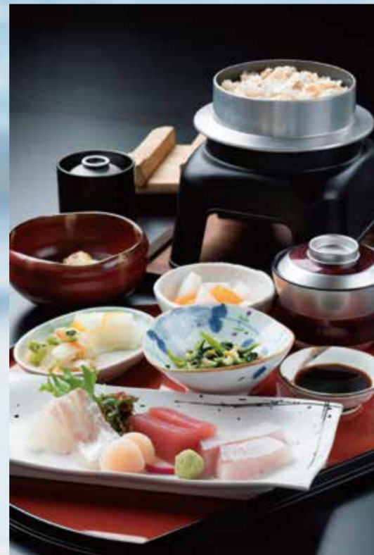
ツアー用加太名産「鯛」ランチ