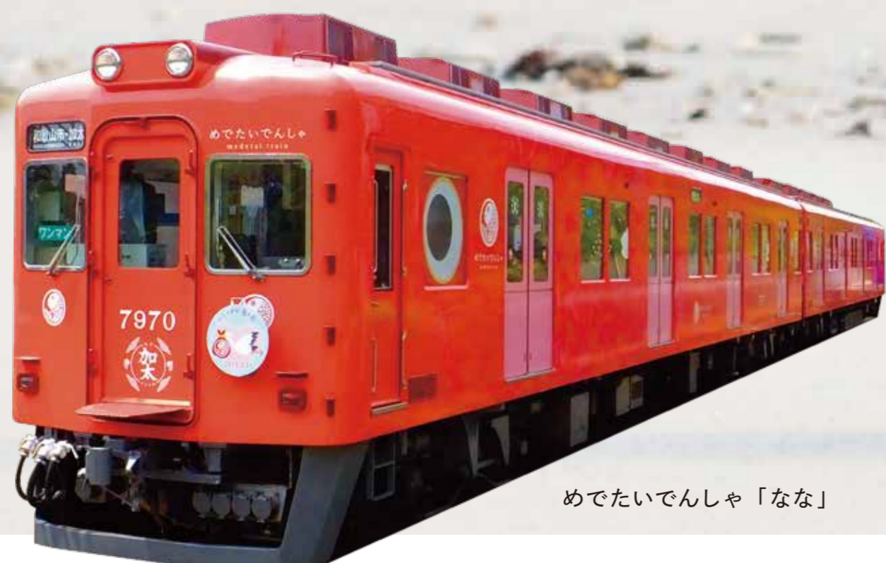
めでたいでんしゃ「なな」